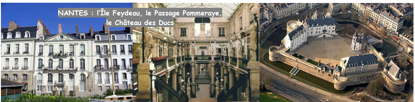
NANTES : l'Île Feydeau, le Passage Pommeraye, le Château des Ducs

Email : info@lacderibou.com site web : www.lacderibou.com