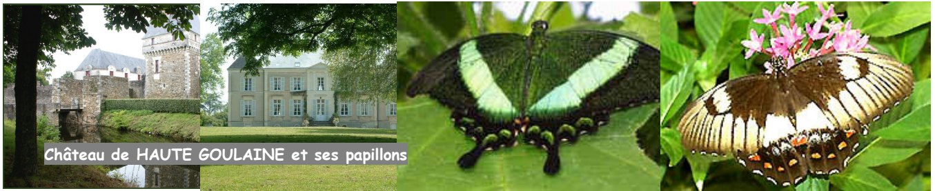
Château de HAUTE GOULAINE et ses papillons

patrimoine artistique, depuis 1880 jusqu'à nos jours. Plus de 500 oeuvres d'art : tableaux, affiches, objets, mobilier. Pour clore cette visite, la volière aux papillons, des centaines de papillons volant en liberté au milieu des visiteurs, dans un décor de plantes rare et un écosystème parfaitement protégé. Déjeuner au restaurant dans la région de MONNIÈRES avant la randonnée des moulins : Belle alternance de bords de rivière, coteaux, vignes moulins. Au fil de votre balade, vous découvrirez trois moulins à vent datant du XVIII e siècle. Petite halte à l'étang des Tuileries avant de revenir dans le centre ville de Monnières pour pousser la porte de l'église Sainte Radegonde (XI e - XVII e siècle) qui mérite le détour notamment pour la couleur de ses vitraux. Ce circuit vient d'être classé « d'intérêt départemental ».