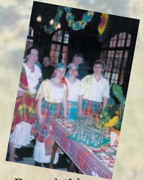
Repas à thème